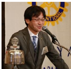
大宮桜木町法律事務所 OMIYA SAKURAGICHO LAW OFFICE

入社後は札幌支店に配属。その後日比谷支店、人事部、大和証券SMBC事業法人部。後、法人営業部(法人の運用です)またリテール部門、宮崎支店で支店長をしました。宮崎は観光地で時間の流れがゆったりした所でした。日南海岸は大変綺麗な場所で、かつては新婚旅行のメッカだったのです。高千穂峡はパワースポット。焼酎はあの有名な霧島酒造は宮崎の会社なんです。じつと、宮崎牛、マンゴーも有名です。