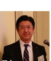
司会 善行地 会員