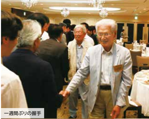
一週間ぶりの握手