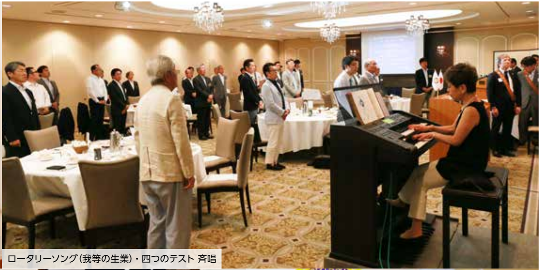
ロータリーソング(我等の生業)・四つのテスト 斉唱