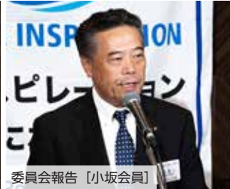
委員会報告 [小坂会員]