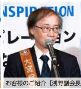
お客様のご紹介 [浅野副会長]