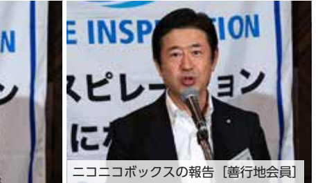
ニコニコボックスの報告 [善行地会員]