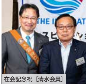
在会記念祝 [清水会員]