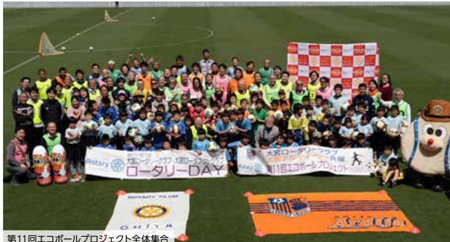
第11回エコボールプロジェクト全体集合