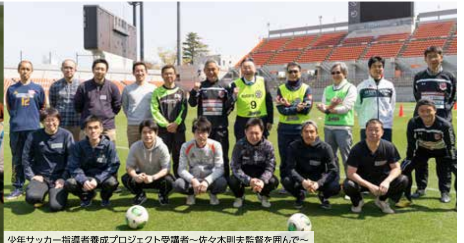
少年サッカー指導者養成プロジェクト受講者～佐々木則夫監督を囲んで～