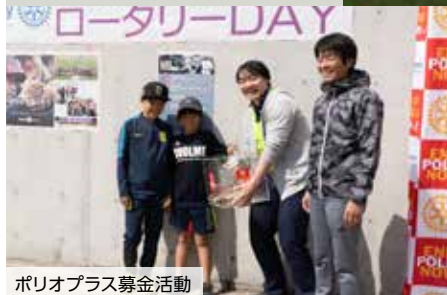
ポリオプラス募金活動