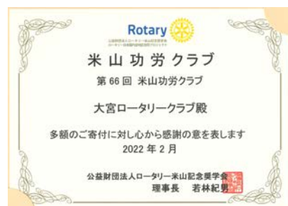
米山功労クラブ感謝状の贈呈 大宮ロータリークラブ66回