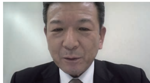
筑摩秀康会員の退会挨拶