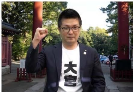
2021-22 年度 活動の軌跡 上映