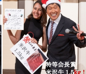
特等会長賞 米沢牛 1.5kg!