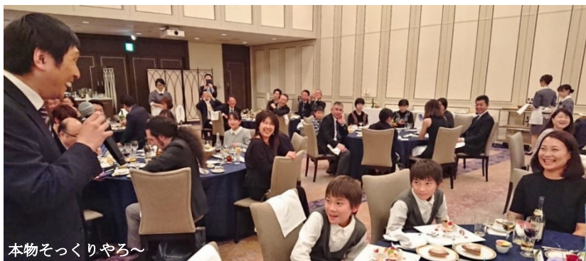
本物そっくりやろ〜