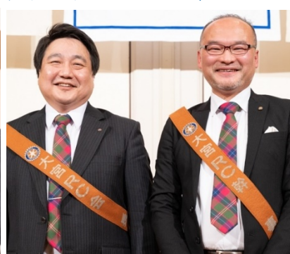
お揃いのネクタイ（幹事からのプレゼント）