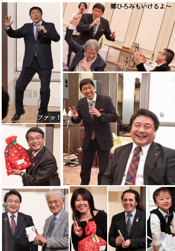
郷ひろみもいけるよ〜