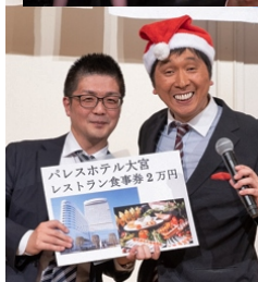
パレスホテル大宮 レストラン食事券2万円