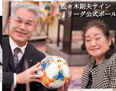
佐々木則夫サイン Jリーグ公式ボール